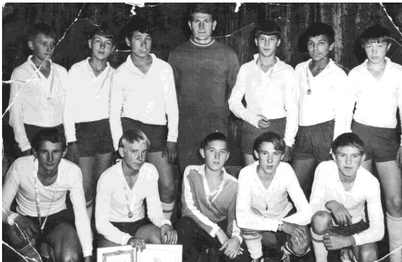
Детская команда "Чайка".

Несколько раз ещё футболисты из Челно-Вершин играли в финалах кубка области - команда колхоза “Малалла” (“Вперёд”, в переводе с чувашского из Нового Алелякова) - в